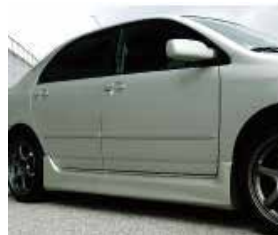
樹脂部品の製造・販売