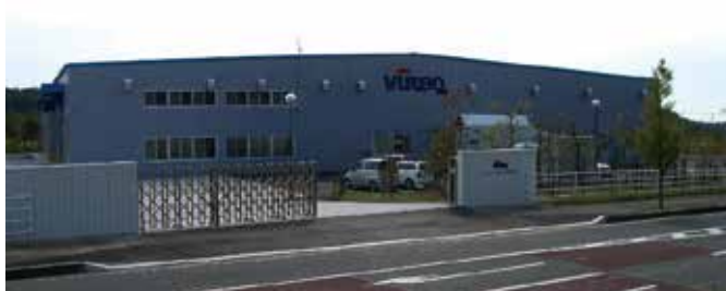
ビューテック宮城営業所