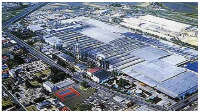
東洋ゴム工業 仙台工場