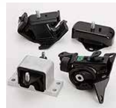
エンジンマウント