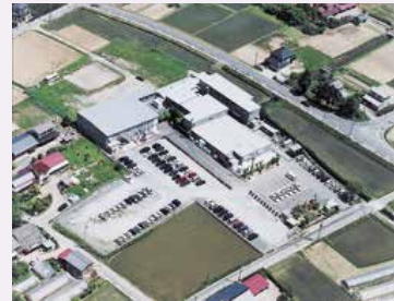
仙台工場・開発研究所