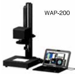
2次元複屈折評価装置