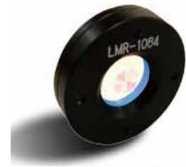
軸対称フォトニック結晶