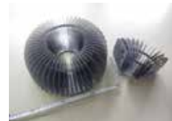
LED照明用ヒートシンク