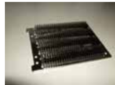
コルゲートフィンヒートシンク