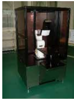
外観検査ロボット