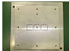
ワイヤーカット抜型