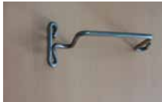
アンテナ支持金具