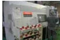
横型中線マシニングセンター