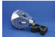
SUSチャンパー 削り出し