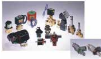
電磁ステンレス鋼の製品例