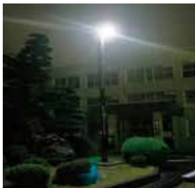
LEDソーラー街路灯【サンカセット】