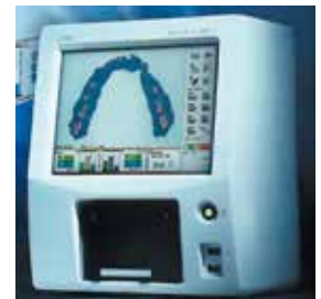
医療機器【咬合可視化装置】