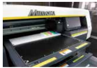
UVインクジェットプリンター MIMAKI製