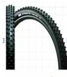
マウンテンバイクタイヤ