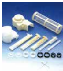
ナイロンメッシュインサート成形