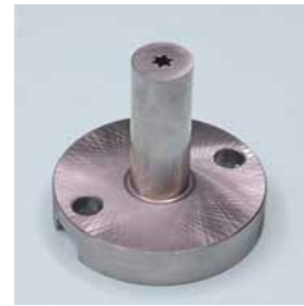
星形スプルー「レボスプルー」