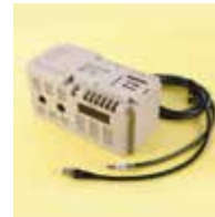
産業機器・医療機器