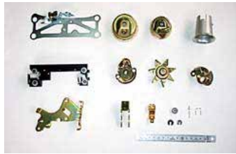
ステーププレート、ファンネル、インペラー、ターミナル、Cワッシャー