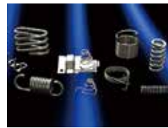
コイル・バネ製品