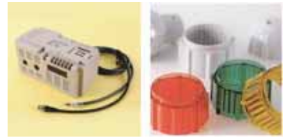
産業機器・医療機器