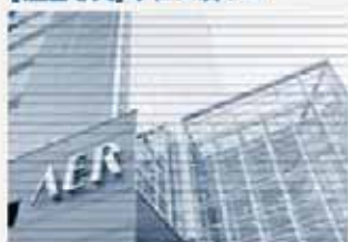
[社屋写真] 本社入居ビル