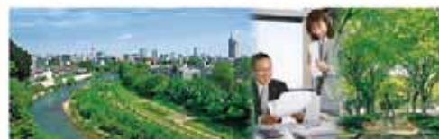
社の都レップオフィス事業/緑あふれる地での足がかり