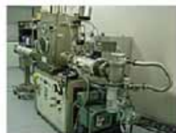
単口ロール急冷装置