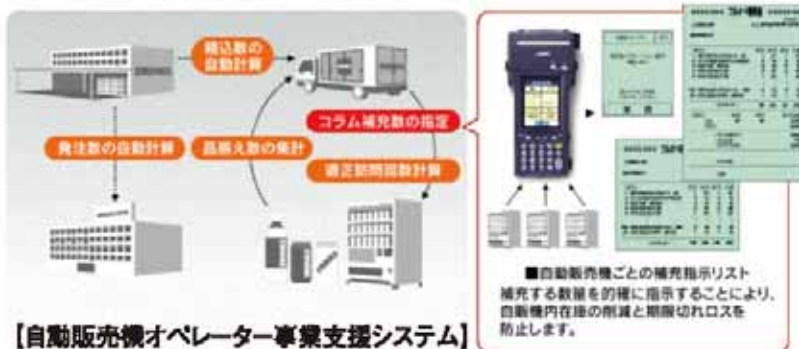
【自動販売機オペレーター事業支援システム】