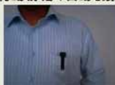
小型ビデオカメラを装着