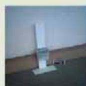
電源不要マイルストーン