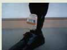
足首用センサーを装着