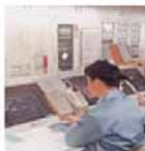
電力設備管理システム