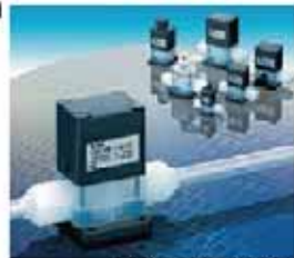
薬液洗浄機(SMD用) フッ素樹脂を素材とした特定市場 (半導体・医療・食品)向けの薬液を 制御するバルブ