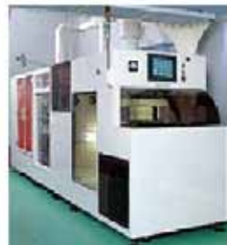
超音波洗浄機(プレテック用) クリーンルーム内のパーティクル (微塵)対策のための洗浄機