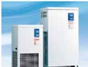
温度調節機器(SMD用) 精密な温度コントロールを可能にした機器