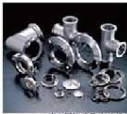
大気浄化機(ミクロ用) 真空設備の環境制御を可能にした装置