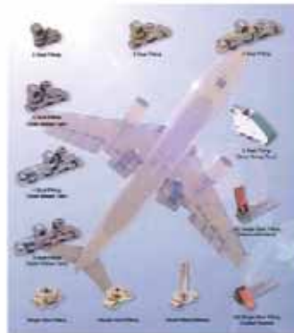
航空機用フィッティング