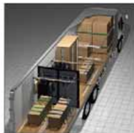
カーゴコントロール製品