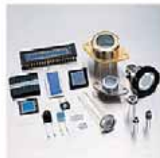
Siフォトダイオード