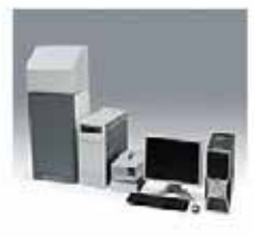
太陽電池評価用製品