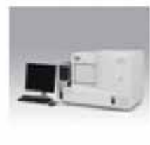
遠隔病理コンサルテーション