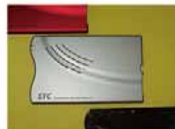
バット印刷・シルク印刷