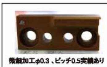
微細加工φ0.3、ピッチ0.5実績あり