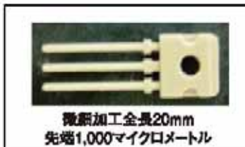
微細加工全長20mm 先端1,000マイクロメートル