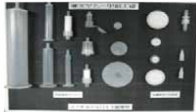
フィルターデバイス製品