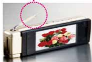
携帯電話用アンテナ部品