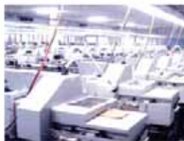
宮城本社工場 製造部