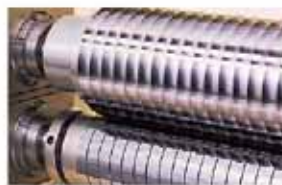
スリッターユニット