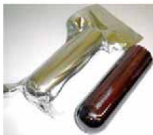
高純度赤リン(インゴット)