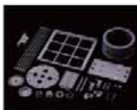
エンジニアリングセラミックス製品