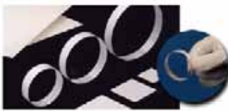
セラフレックス®(ジルコニア薄板)