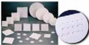
高品位アルミナ基板