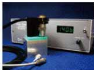
顕微鏡用高精度位置決めシステム