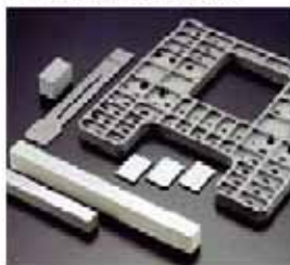
ゼロ膨張セラミックス