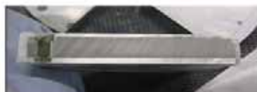
アルミニウム内部に高剛性MMCを内包