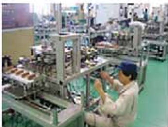
省力化機器設計・製作