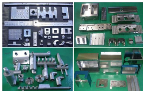
< 量産部品 >