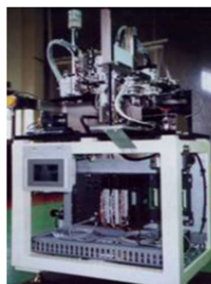
< 自動化設備 >