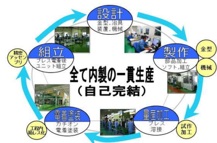
全て内製で一貫対応(自己完結)

☆社員の 7 割以上が高スキル資格を保有する技術者集団による 高度かつ確実な作業