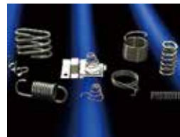
コイル・バネ製品