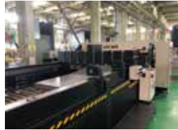
オートシャーリング