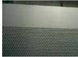
パンチングプレス製品