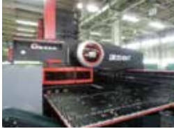
CNCタレットパンチプレス