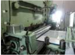
パンチングプレスライン