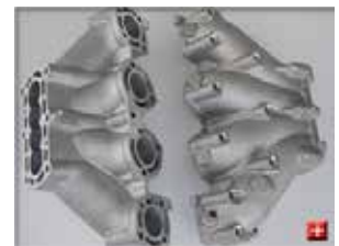
4-1型冷却管 (可傾式重力金型鋳造工法)