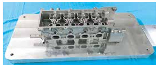
4気筒シリンダーヘッド 金属3Dプリンタ XLine製