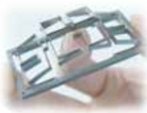
【精密微細切削加工品】