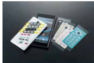
電子機器 (ボタン・キー)