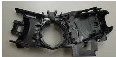
ステアリングコラム部品 (海外工場生産)

金型設計、加工から量産まで、0.001mm単位での管理が必要な製品の生産実績あり。