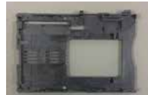
ETC部品 (海外工場生産)