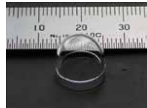
医療用レンズ部品