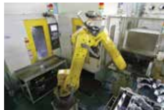
ロボット搬送全体取り合い部