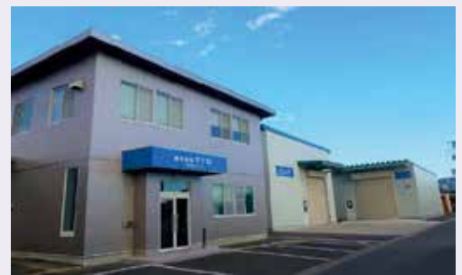
本社第一工場・第二工場・第三工場