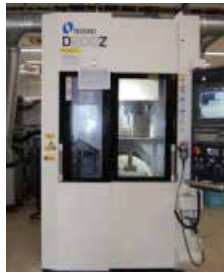
5軸加工機・加工イメージ