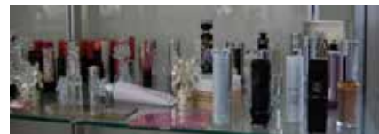
◇化粧品各種部品（インジェクションブロー含む）