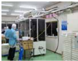
自動シルク印刷機