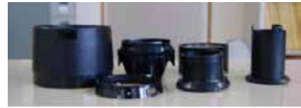
◇各鏡筒部品（外側-4方向/内側-6方スライド）