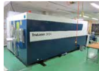
トルンプ製最新レーザ加工機