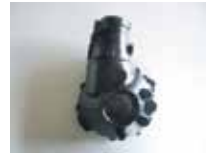
キャリアケース (自動車部品)