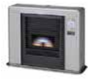
ストーブ (ストーブ部品)