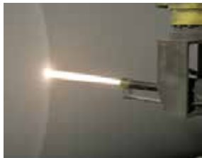
○溶射皮膜は各種機能を付与 (金属/セラミック/サーメット)