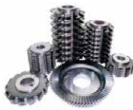
○切削工具 ドリル/ボブカッター/ スリッター刃など