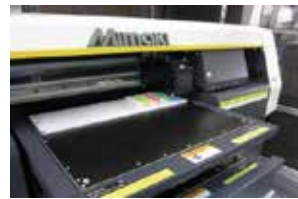
UVインクジェットプリンター MIMAKI製