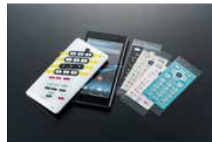
電子機器 (ボタン・キー)